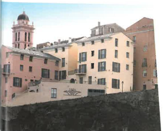
Hôtel des Gouverneurs

Du côté de l'île Rousse se niche un petit hôtel de charme, le Liberata 4* (22 chambres), à 50 mètres de la plage, qui accueille des séminaires résidentiels hors saison – il reste ouvert du 1 er mars au 20 décembre – profitant d'un espace bien-être et d'un salon. A Saint-Florent, La Roya 3* s'apprête à vivre une importante phase de réaménagement qui, outre le fait de le voir passer en 4* en 2017, portera à 24 le nombre des chambres et à 7 celui de ses suites. Pourvu d'un restaurant étoilé (1* Michelin) de 40 couverts, et 40 en extérieur, il offre aussi une salle (30 personnes), une piscine lovée dans un très beau jardin coulant vers la plage. Le propriétaire, et capitaine de bateau, met aussi à disposition un bateau-navette (11 passagers)