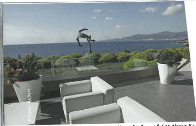
Radisson Blu Resort & Spa Ajaccio Bay