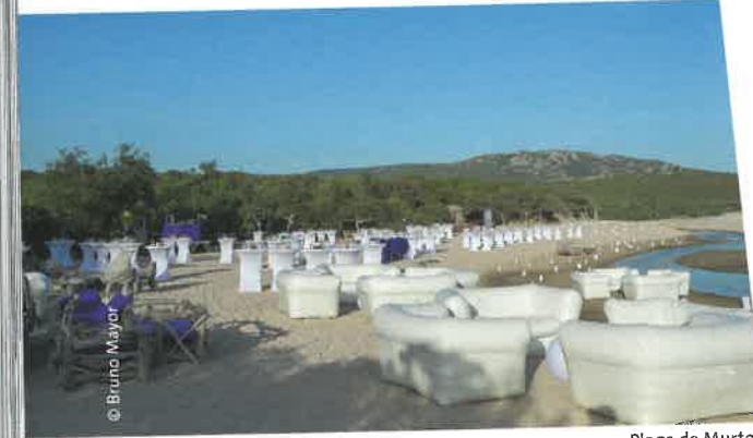
Plage de Murtoli

sûr par sa capacité mais aussi pour ses équipements : 6 salles dont 1 plénière, jusqu'à 140 personnes, un restaurant, un bar, une piscine. Seule contrainte pour les groupes, un minimum de 3 nuits est requis.