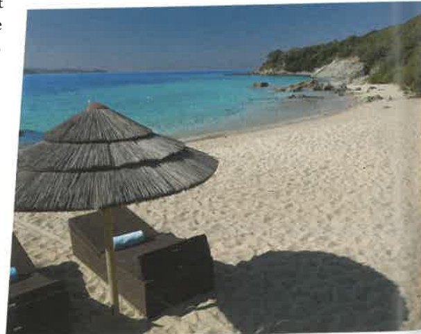
Marinca & Spa

Enfin, non loin de Sartène, existe l'un des établissements les plus étonnants et dépaysants qui soient, le Domaine de Murtoli . Sur 2500 hectares de maquis majestueux bordés de 8 km de plages sauvages, le site ouvert à l'année recèle 19 bergeries authentiques, soit 42 chambres en tout pour 108 couchages (une 20 ème est prévue pour 2017), plus belles les unes que les autres, pour lesquelles un service hôtelier haut de gamme est largement assuré, un parcours de golf 12 trous unique dans sa conception, 3 restaurants - La Grotte qui a investi une grotte naturelle (privatisable sur demande, jusqu'à 50 personnes), La Ferme (150 couverts) avec un bar surmonté d'une mezzanine pour les réunions (50 personnes) et une cave à vins (dégustations pour des groupes de 10-12 personnes) et la Plage pour des robinsonnades de luxe - un bar et un espace détente sur la plage, une zone hélicoptère. Exploitation agricole toujours en activité (veaux et vaches, 5000 oliviers, 13 ha d'immortelles, ruches, etc.) mêlant un concept agrotouristique de luxe, ce domaine qui nécessite d'être véhiculé, se prête parfaitement au Mice, développant des offres appropriées et all inclusives (aérien, nuitées, activités hors domaine et location de véhicules).