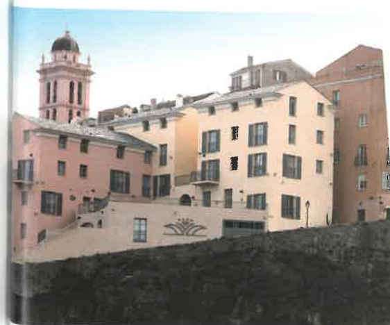
Hôtel des Gouverneurs