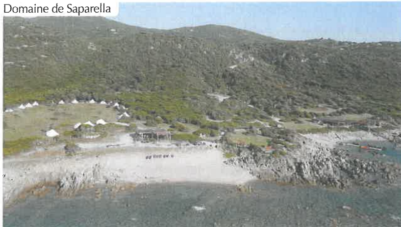
Domaine de Saparella