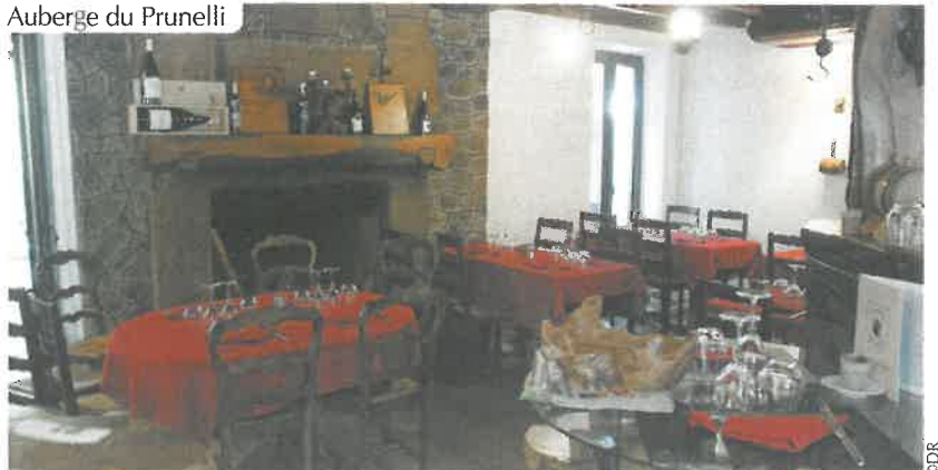
Auberge du Prunelli