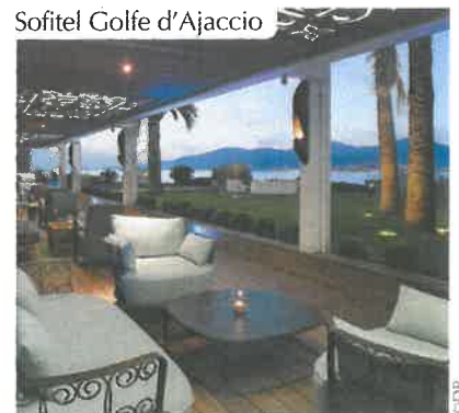
Sofitel Golfe d'Ajaccio

www.radissonblu.com/fr/resort-ajacciobay