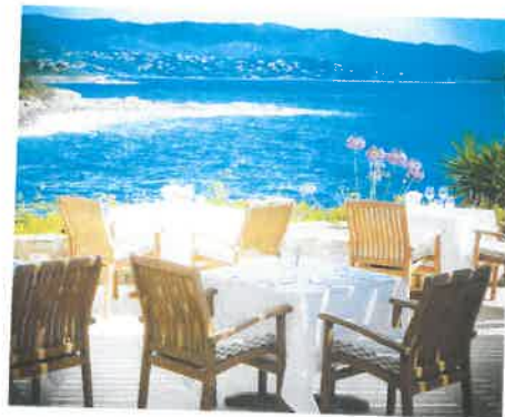
La terrasse du restaurant