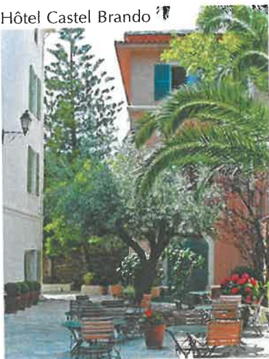
Hôtel Castel Brando