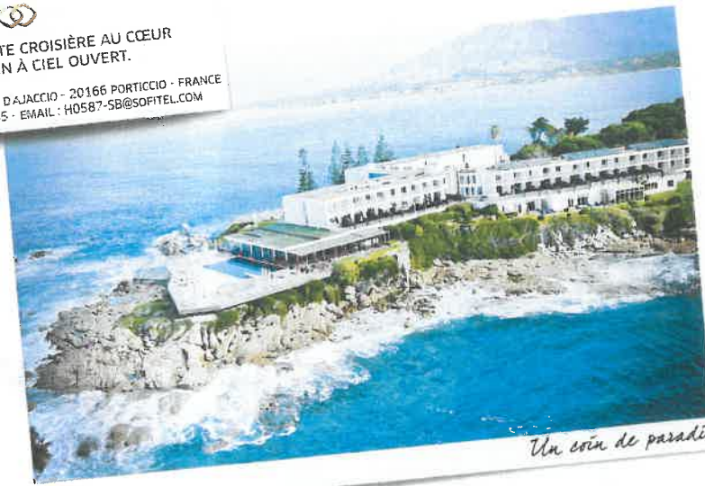
Un coin de paradis

DOMAINE DE LA POINTE GOLFE D'AJACCIO - 20166 PORTICCIO - FRANCE TEL. : +33 (0)4 95 29 40 45 - EMAIL : H0587-SB@SOFITEL.COM