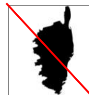
Les « non-visiteurs »