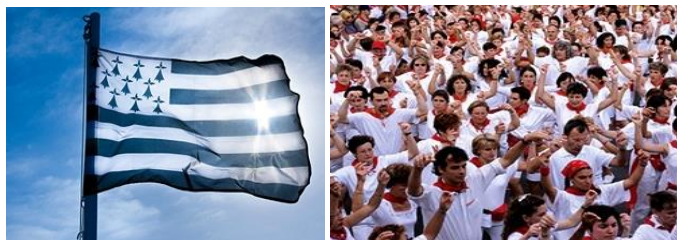
Bretagne – Pays Basque

« Je dirai la Bretagne car les gens de ce côté-là sont aussi chaleureux et francs » (G1)