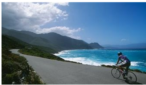
A la mer