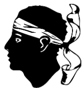
Les « visiteurs »