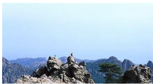
A la montagne