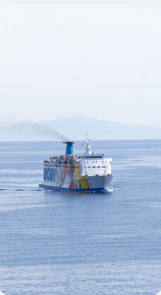
Fig. 3 - Arrivées dans les ports et aéroports de Corse en juin 2025 & évolution avec juin 2024